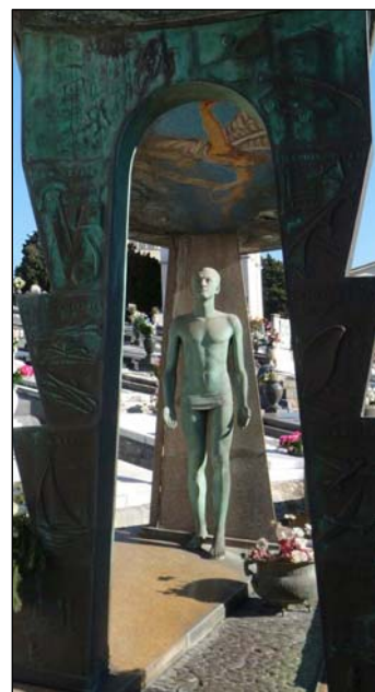
La Spezia, cimitero di Cà di Boschetti Tomba Bargiacchi Tognelli

Info: tel. 0187 66811 - sba-lig.museoluni@beniculturali.it