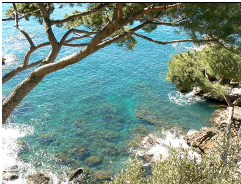
Fondazione Bogliasco – Villa dei Pini

Info: tel 019 883914 - villagroppallo@libero.it